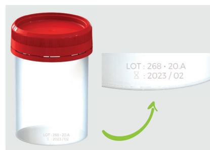
Numéro de lot et date de péremption

Découvrez nos nouveaux pots gradués en polypropylène avec bouchon à vis en polyéthylène . Ces pots translucides sont utilisés pour le prélèvement , le stockage et le transport d'échantillons liquides ou solides. La traçabilité est garantie par un marquage laser sur chaque pot. Profitez d'un large choix de volumes de 80 à 180 ml .