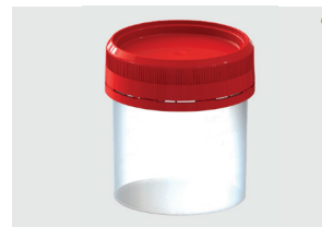
Cape inviolable prévisée

Partiellement vissée, la bague d'invulnabilité n'est pas enclenchée. L'utilisateur l'enclenche en vissant la cape après le prélèvement.