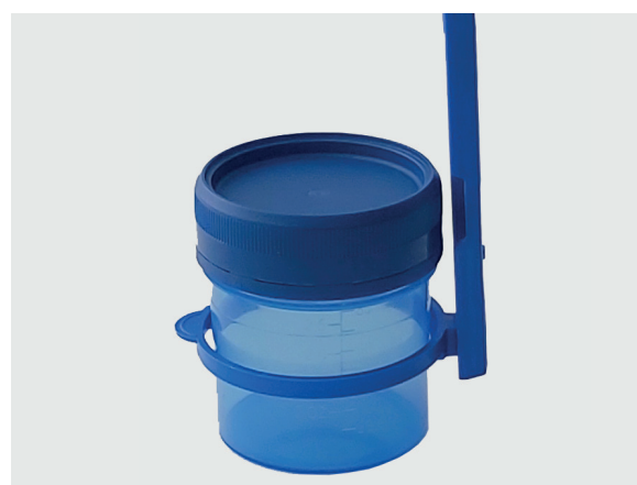
Après le prélèvement, la anse est chassée de son emplacement en vissant le bouchon.