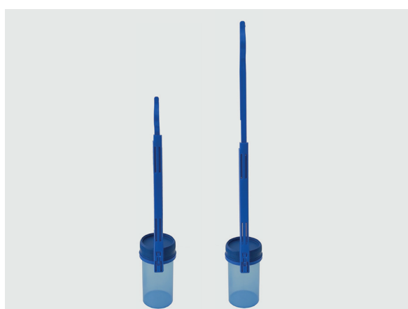
La anse amovible permet de sélectionner la version longue ou courte pour le prélèvement.