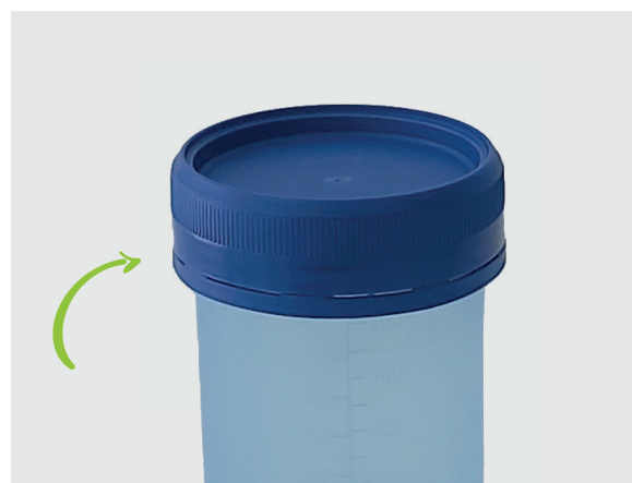
Cape inviolable préviscée : L'utilisateur enclenche la bague d'invocabilité en vissant la cape après le prélèvement.