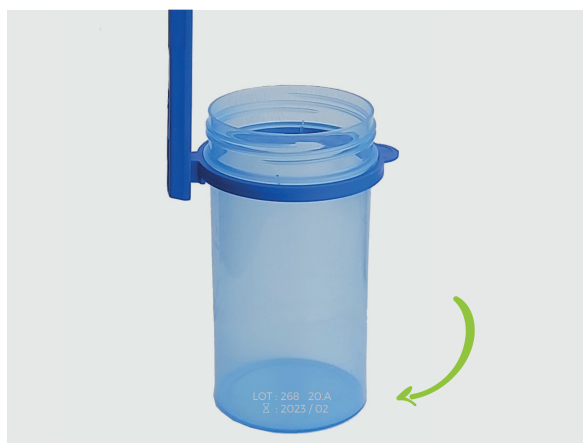
Traçabilité de chaque pot par marquage laser du n° de lot et de la date de péremption.