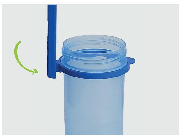
La anse amovible est coincée dans la bague d'invocabilité ce qui assure un excellent maintien du pot pendant le prélèvement.